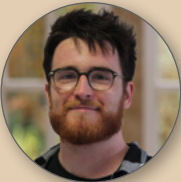
Fragen rund um das Seminarmanagement:

Johannes Gutenberg-Universität Mainz Zentrum für wissenschaftliche Weiterbildung Samuel Eastman 55099 Mainz Tel.: 06131/39-31070 E-Mail: onkologie@zww.uni-mainz.de