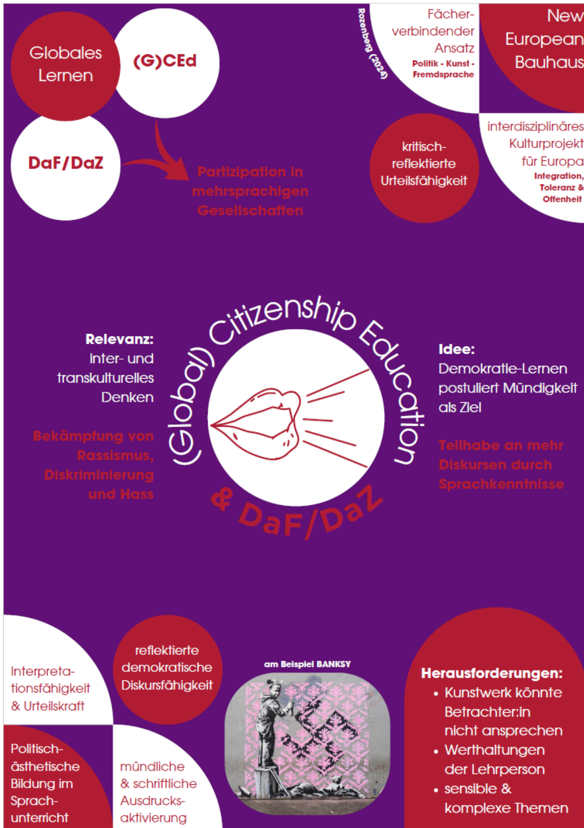
Poster zur mündlichen Prüfung im Master DaF/DaZ (26.02.2024)