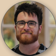
Fragen rund um das Seminarmanagement: