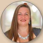
Fragen rund um das Seminarmanagement: