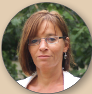
Fragen rund um das Seminarmanagement: